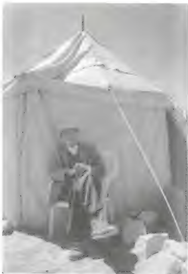
لویر بموقع بی بی مارس عام ۲۰۰۰ یستریح اثناء زیارتہ